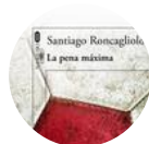
"La pena máxima" - Santiago Roncagliolo